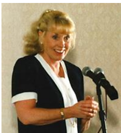
Betty Williams et Mairead Corrigan

Emily Greene Balch , est une économiste, pacifiste et syndicaliste américaine, prix Nobel de la paix en 1946 pour la création de « la Ligue internationale des femmes pour la paix et la liberté ».